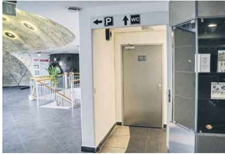
TOALETY V PARKOVACÍM DOMĚ na Staroměstském nám. trpí kvůli problémovým osobám.

V minulosti bývaly veřejné toalety dostupné u parkoviště v Pivovarské ulici. V souvislosti s rekonstrukcí Staroměstského náměstí a výstavbou parkovacího domu se toalety přemístily právě sem. Veřejnosti jsou zpřístupněny bezplatně a bez trvalé lidské obsluhy. Bohužel se opět ukázalo, že to, co se neplatí, nemá pro část lidí hodnotu. Namísto toho, aby toalety v parkovacím domě sloužily široké veřejnosti, jsou spíše místem hrůzy a hnusu. Hojně je využívají osoby bez domova, které zde rády spí. Výjimkou nejsou ani lidé závislí na drogách. Znečištění toalet je někdy tak nechutné, že se zvedá žaludek i otrlým osobám. Desítky